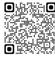
[登録科目の履修中止申請について]